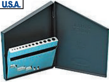
#11050 ¥1,700 1.0~7.0mm / (0.5とび) 【13本】