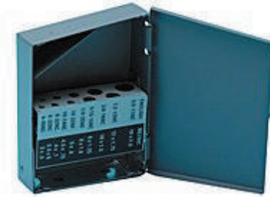
#12590 【タップ用10本】 ¥4,000 M3 x 0.5 M5 x 0.8 M12 x 1.75 M3.5 x 0.6 M6 x 1.0 M16 x 2.0 M4 x 0.7 M8 x 1.25 M4.5 x 0.75 M10 x 1.5