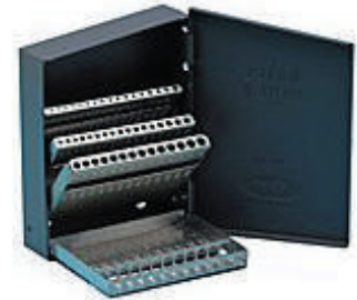
#11150 ¥2,700 1.0~10.0mm / (0.5とび) 【19本】