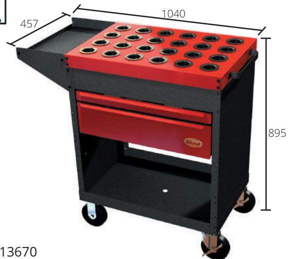
#13670 【HSK63A用】 ¥243,000 上段: 高さ50mmタテ6列仕切り 下段: 高さ150mm仕切りなし