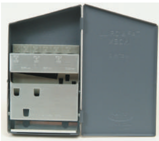
#12675 【タップ&ドリル用】 ¥2,200 M2.5 x 0.45, M3.0 x 0.50, M3.5 x 0.60, M4.0 x 0.70, M5.0 x 0.80, M6.0 x 1.00, M8.0 x 1.25, M10 x 1.50, M12 x 1.75 2.05, 2.50, 2.90, 3.30, 4.20, 5.00, 6.70, 8.50, 10.20mm