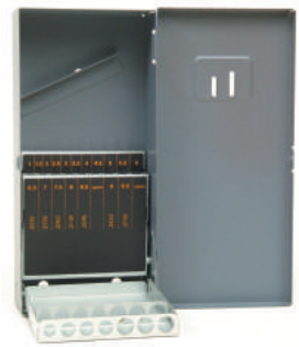
#12130 【リーマ用 25本】 ¥6,600 1.0~13.0mm / (0.5とび)