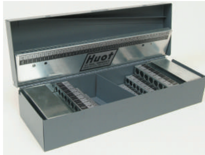
#11825 ¥36,000 1.0~2.5mm / (0.05とび) 2.6~13.0mm / (0.1とび) 【118本】