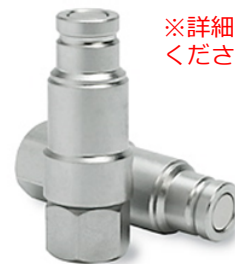
残圧除去機構付きニップル